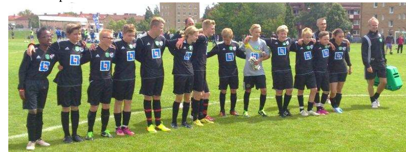
Nöjda spelare och ledare efter en vecka på Gothia cup.