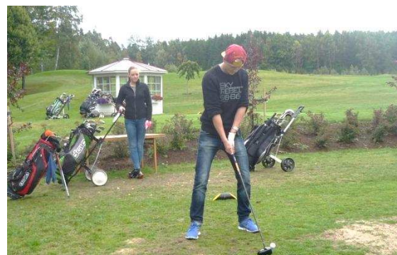
Elin kollar in när Wilhelm ska slå sitt första slag i tävlingen

vill vi tacka alla som deltog och hälsar er och de som inte var med i år till nästa års Vegbymästerskap. Vi siktar på nytt deltagarrekorde!!