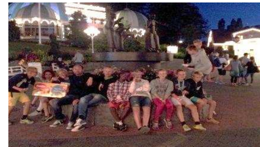
På väg till och på Liseberg.

Sammantaget en mycket lyckad vecka med 14 underbara spelare som verkligen höjt sig som spelare och lag. Detta har märkts både på träning och matcher i höst då vi endast har förlorat en match, den mot Borås AIK som vinner serien. Vi vill också tacka alla som sponsrat oss och alla föräldrar som hjälpt till. Utan er hade det inte blivit någon Gothia cup. TACK!!!