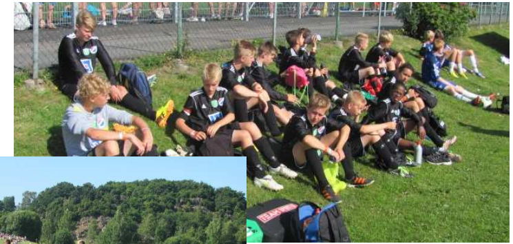
Uppladdning och värming före match.

På torsdag blev det match mot IK Sleipner, ett mycket bra lag från Norrköping. Här blev det förlust med 7-0 och därmed var vi utslagna ur Gothia cup. Det fanns många deppiga spelare efter den matchen, vi ville ju så gärna fortsätta. Sleipner gick sedan till B-final och vann över Brommapojkarnas 1:a lag. Sista kvällen avslutades på Liseberg och då var förlusten redan glömd.