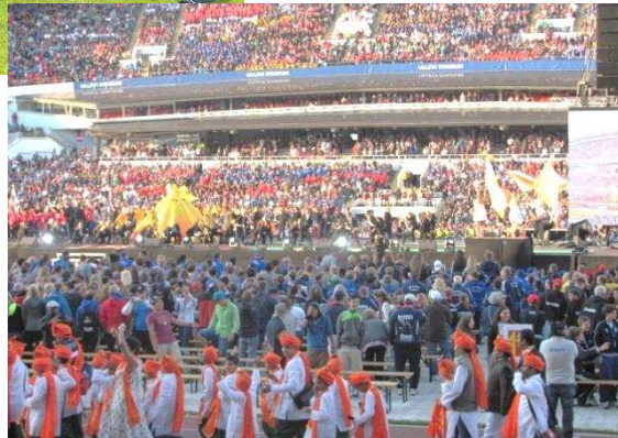
Invigningen på Ullevi

Tisdag andra matchen spelades mot ett hårt och tufft lag från Kosovo, KF Feronikeli. Här var vi helt chanslösa och förlorade med 7-1. Dagen avslutades med veckans första besök på Liseberg, det blev några stycken.