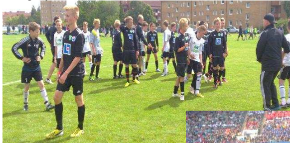
Tackar våra motståndare från Island

Första matchen spelades på måndagen, motståndarna var FH2 ett lag från Island. Många nervösa spelare innan matchen men vi gjorde en bra match och spelade 2-2. Senare på kvällen väntade invigningen på ett fullsatt Ullevi, med kända artister och häftigt fyrverkeri.