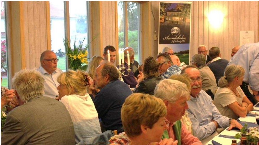
Feststämning på Åsundsholm!