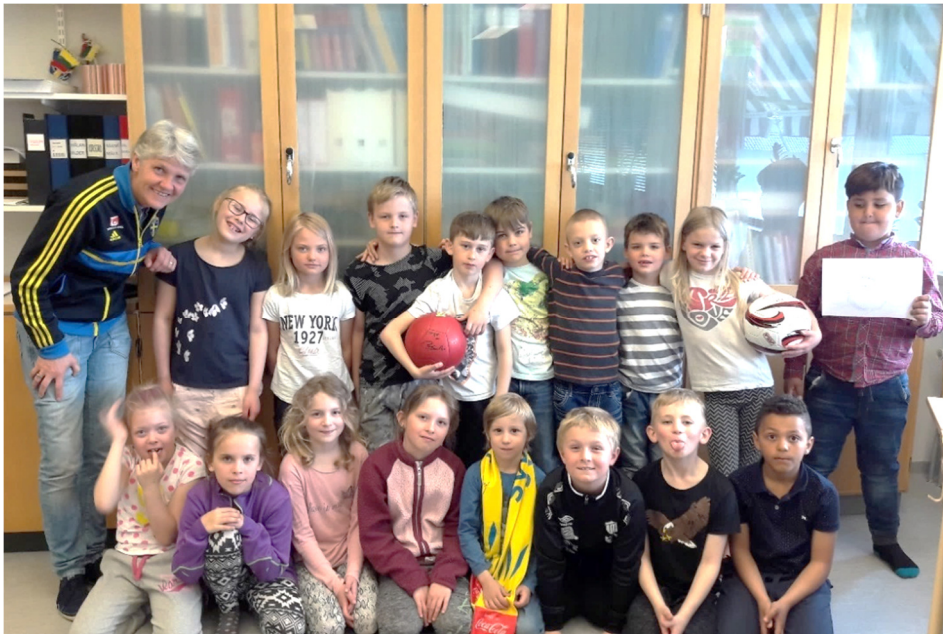
Fint besök i Vegby skola

Vegby-bladet nr 2 2017, Årgång 8 Utgivet av Vegby Sportklubb, Vegbyortens Hembygdsförening och Byalaget VEGA vegbybladet@vegby.se