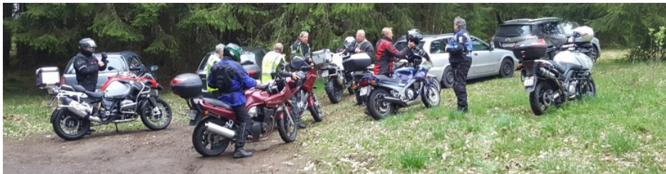
Fler motorcyklar än bilar på parkeringen den här kvällen