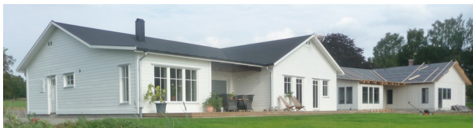
Fasader mot sjön. Den indragna fasaden är helt i glas ända ner tillgolvet