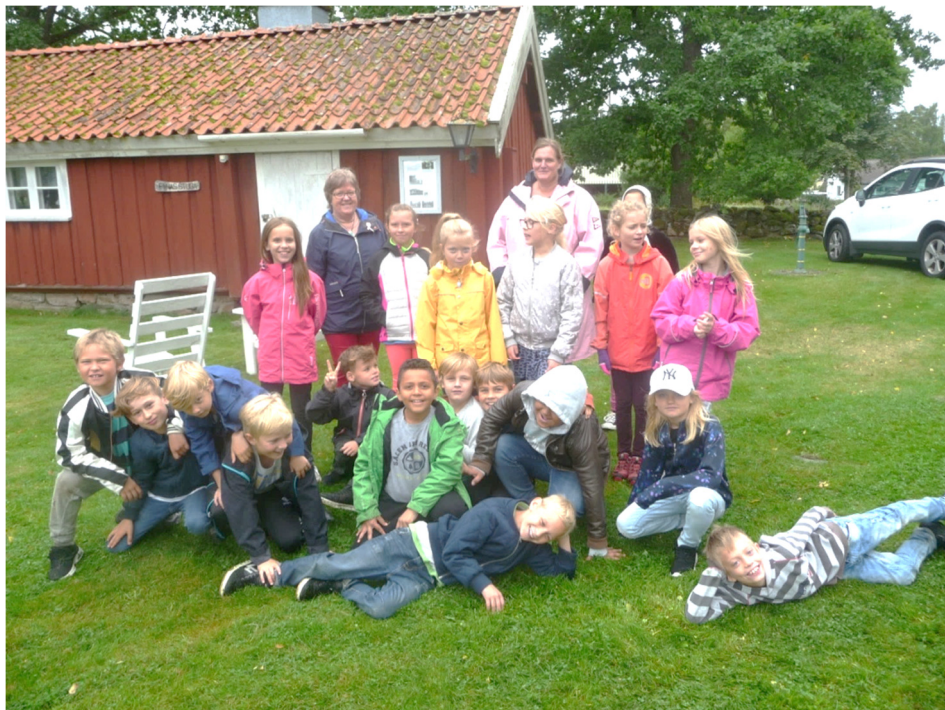
Klass 2 och 3 på besök i hembygdsparken

Vegby-bladet nr 3 2017, Årgång 8 Utgivet av Vegby Sportklubb, Vegbyortens Hembygdsförening och Byalaget VEGA vegbybladet@vegby.se