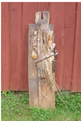
Här en bild av materialet som användes

När det gamla cementteglet på bostadshuset skulle bytas ut mot nytt sådant fann man att taket varit täckt med både halm och torv som fanns kvar tills nu med teglet ovanpå. Man kan också se på gamla foton att byggnaden ännu tidigare varit täckt med lertegel. Varför huset, som sägs vara byggt någon gång i slutet av sjuttonhundratalet, hade torv på framsidan och halm på baksidan är en gåta. Kan det möjligen vara så att taket på baksidan, av någon anledning, senare lagts om och att man då använt sig av halm istället för torv och låtit nävern vara kvar. Bara en gissning. Ett rätt utfört halmtak håller nämligen vätan ute av sig självt. När det var frågan av torvtak användes på den tiden alltid näver som skydd mot väta och låg då direkt på en brädbotten med torven ovanpå.