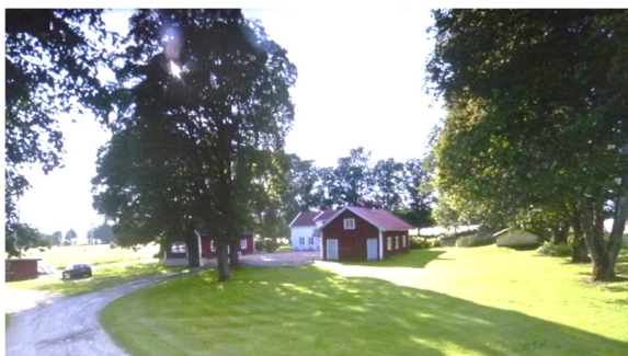
Den byggnad på vilken takbytet utförts är den vita byggnaden i mitten

På en tillvaratagen bräda kan man nämligen se att både näver och halm använts. Takkonstruktionen bestod av vertikala regler på ca en meters mellanrum vilande på ytterväggen samt en stock i nocken och en mittemellan. En del av detta fick bytas ut på grund av röta. Efter att takkonstruktionen reparerats har allt ovanpå bytts ut och utförts enligt dagens krav med råspånt, papp och tegel. Bostadshuset i Bosgården med sina två flygelbyggnader inramat med stora lummiga träd är en vacker byggnad längst söderut i Sämbyn.