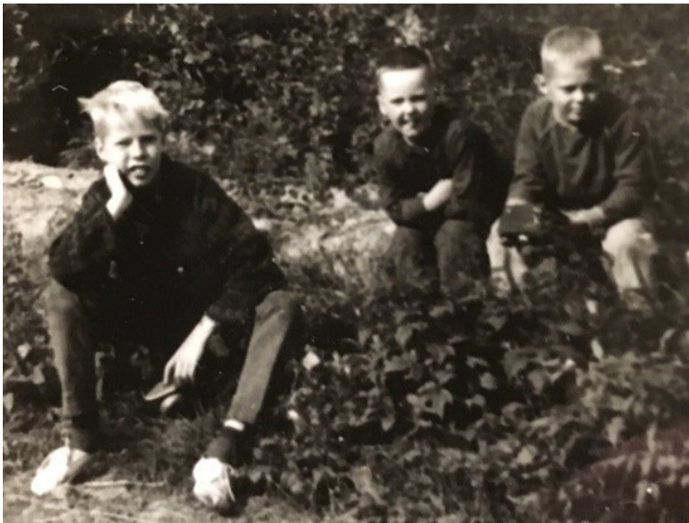
Vi funderar på vilken lada vi ska ta nästa gång