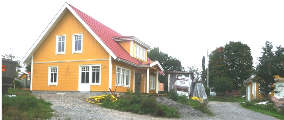
Ett vackert hus med bra utsikt över Sämsjön. En skymt av gäststugan syns längst till höger i bilden.

Från början var tanken att det bara skulle bli en tillbyggnad av det gamla huset där i varje fall en del av väggarna kunde ingå men det visade sig att det blev svårt att få en vettig planlösning så det var inget att spara på så därför fick det bli nybygge i stället. Det nya huset, som håller på att byggas är ett ett-och ett halvplanshus utan källare och är vänt vinkelrätt mot det gamla huset. Uppvärmningen sker med golvvärmslingor som får sin värme från en luftvärmepump. Starten på bygget blev en hel del försenat på grund av strul med samverkansnämnden för miljö och bygg angående höjden på huset. Bygglov blev så småningom beviljat så nu är i alla fall bygget en bra bit på väg och ser ju någorlunda färdigt ut utvändigt. Invändigt återstår förstås en hel del att göra men ägarna tänker utföra en stor del av detta själva. Cato är ledig från sitt jobb i sjuveckorsperioder för att däremellan vistas lika långa perioder på sin "flytande" arbetsplats där det fartyg han har högsta ansvaret för kommer till rätt hamn. Cato har dessutom skaffat sig en del erfarenhet av byggnadsarbete i Norge innan han flyttade till Sverige. Familjen hoppas kunna flytta in i det nya huset, om inte till jul, så näst gång under vintern.