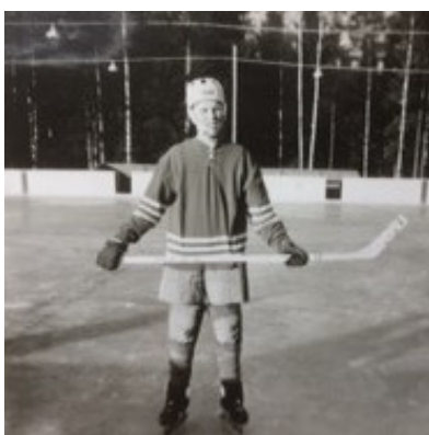
Jag på isen 1965