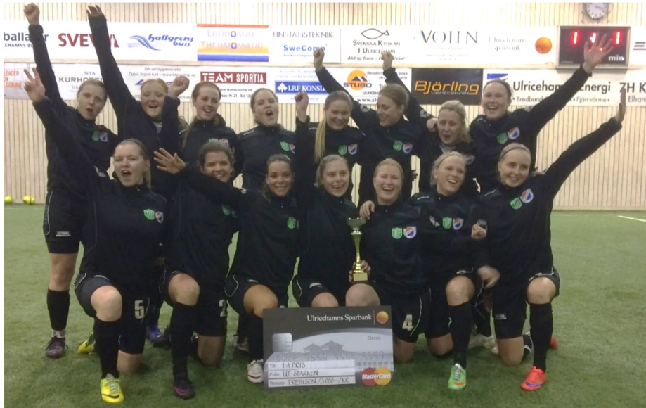
Segrande lag i UT-sparken 2017