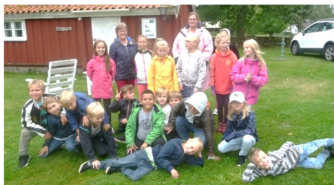
Här är båda klasserna samlade på ett och samma ställe