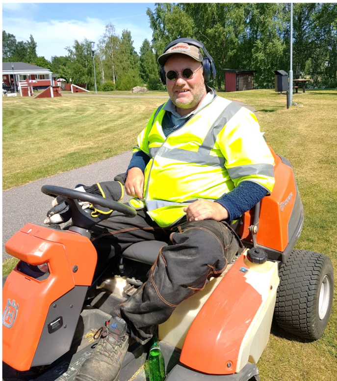
Kennet som bor i Knätte har satt sig tillrätta på gräsklipparen

För att hålla snyggt och städat i Vegby samhälle faller ansvaret på vägföreningen. Gräset skall klippas på lekplatser, badplatsen, Sjöparken och andra allmänna grönområden. Det går ju heller inte att köra med en åkgräsklippare över allt så man måste också använda både trimmer och vanlig gräsklippare. Kratta och spade är också redskap som förekommer vid t.ex. rensning av rabatter och planteringar m.m.