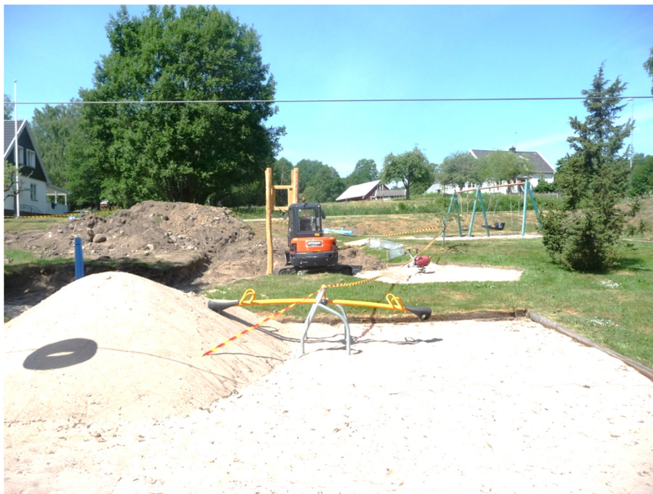
Grävmaskinen ingår inte i lekutrustningen

Befintliga klätterhuset i den stora sandlådan byts ut mot ett nytt klätterhus med rutsch och en lite annorlunda vippunga kommer också att finnas när allt är klart.